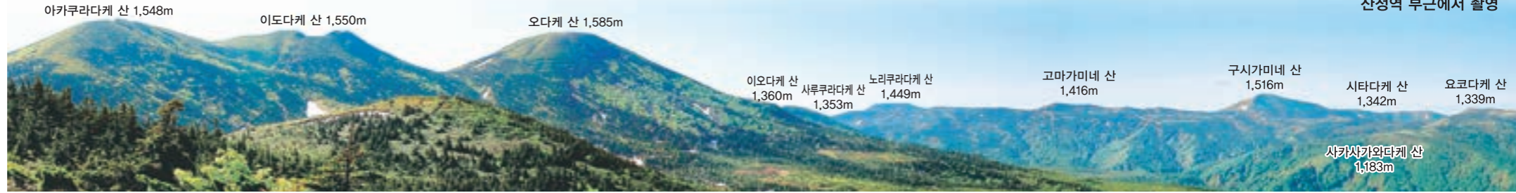
아카쿠라다케 산 1,548m